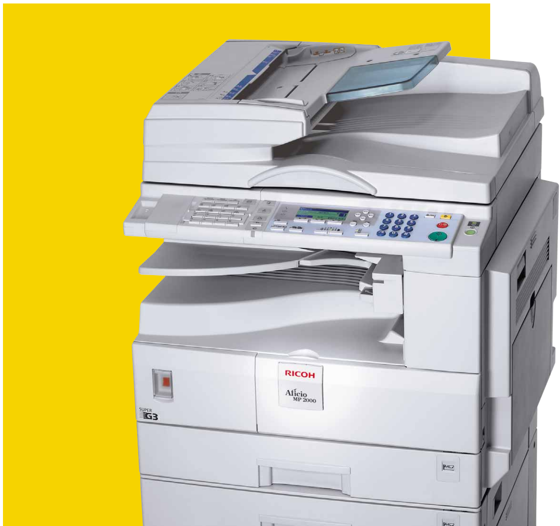
Aficio™ MP 1600/MP 2000